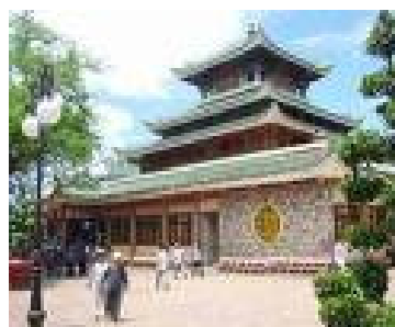
Miếu Bà Chúa Xứ Núi Sam